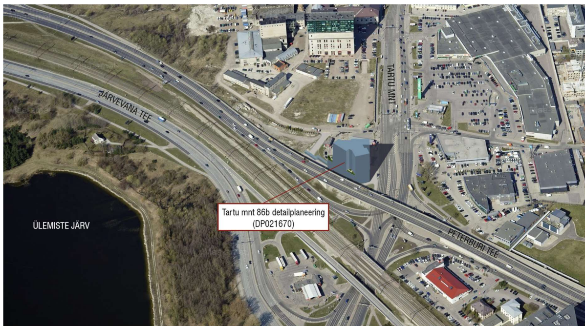
Joonis 1. Projekteeritava ärihoone 3D-visuaal

AS Fausto Capital korraldab Tartu mnt 86b ärihoone projekteerimiseks (edaspidi võistlustöö) arhitektuurikonkursi (joonis 1). Võistlustöö eesmärk on leida parim kaasaegne arhitektuurne lahendus, mis vastaks detailplaneeringule, võistlustingimuste lähteülesandele, sh olulisematele arhitektuurinõuetele (ptk 1.3.), ning oleks väärikas maamärk linna ühes tähtsaimas sõlmpunktis.